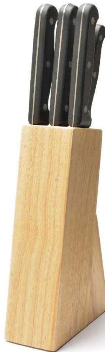
Cuchillos de cocina Set 5 Und. con base de madera Set of 5 Knife with Block

Ceramic blade knives, providing precise cuts, they are ultra-lightweight, have handle with raised support to prevent contact of the blade with the cutting surface and comes provided with a protective cover for its protection.