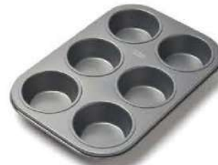
Molde Redondo 32 x 30 x 5 cm Round Cake Pan 12 3/5" x 11 4/5" x 2"